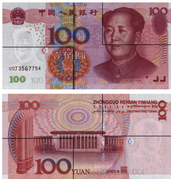
图B.1 壹佰圆检测采样点