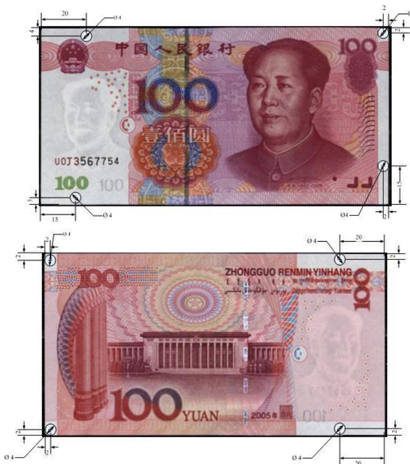
图A.1 壹佰圆检测采样点 (单位: mm)

分别在正面和背面各选取4个非印刷无水印区采样点，如图A.1、A.2、A.3、A.4、A.5、A.6所示。