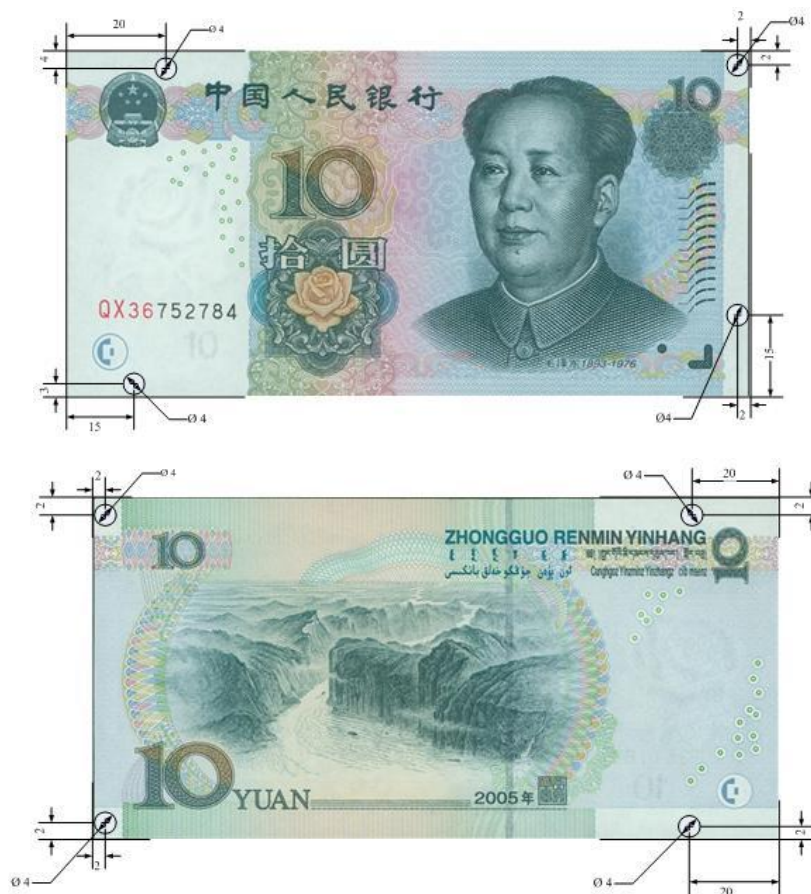
图A.4 拾圆检测采样点 (单位: mm)