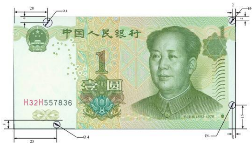
图A.6 壹圆检测采样点 (单位: mm)