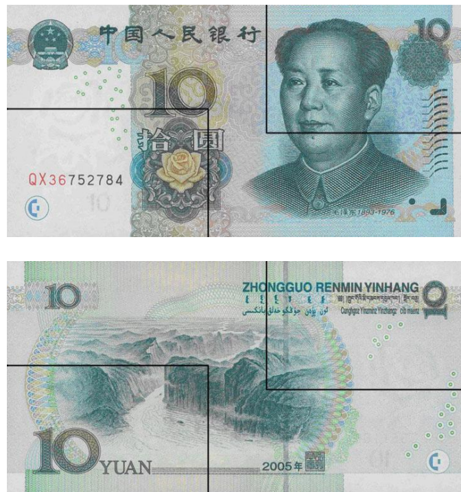
图B.4 拾圆检测采样点