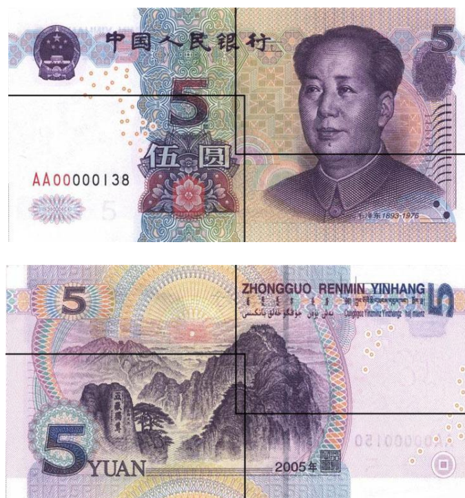
图B.5 伍圆检测采样点